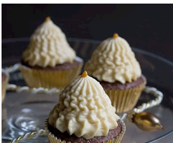
Brownie Cupcakes mit Karamell und Spekulatius