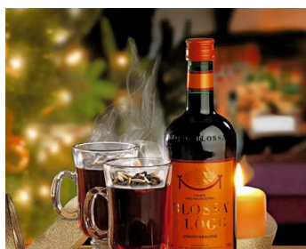
Schwedischer Glögg Weihnachtspunsch