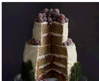
Winter Wonderland-Torte mit Cranberries