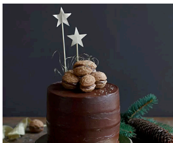
Nougat-Torte mit Zartbitter- schokoladen-Ganache