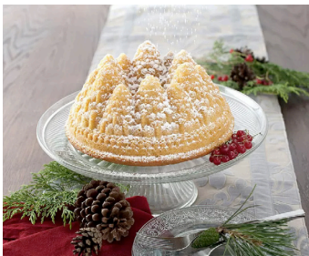
„Tannenbäume“ (nach Lebkuchen-Art)