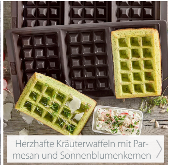
Herzhafte Kräuterwaffeln mit Parmesan und Sonnenblumenkernen