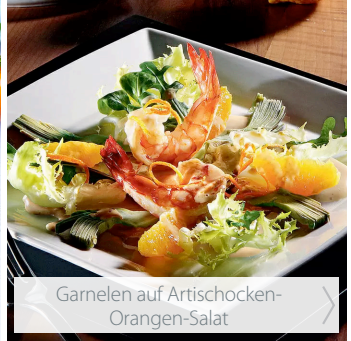
Garnelen auf Artischocken- Orangen-Salat