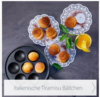
Italienische Tiramisu Bällchen

Noch mehr Rezeptideen finden Sie auf hagengrote.de