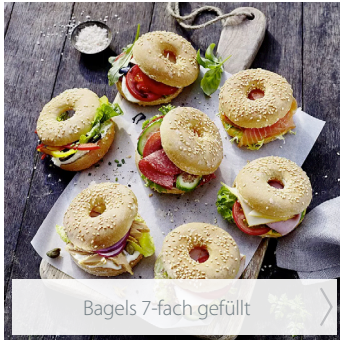
Bagels 7-fach gefüllt