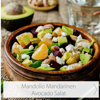
Mandolin Mandarinen Avocado Salat