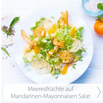
Meeresfrüchte auf Mandarinen-Mayonnaisen Salat