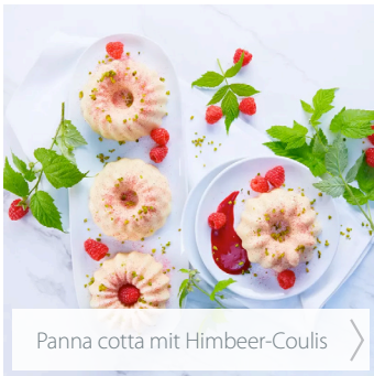
Panna cotta mit Himbeer-Coulis