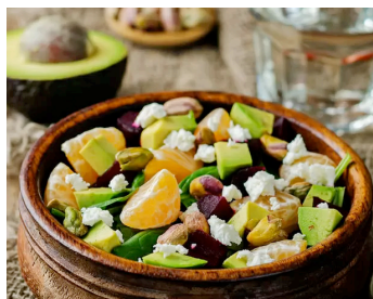
Mandolin Mandarinen Avocado Salat