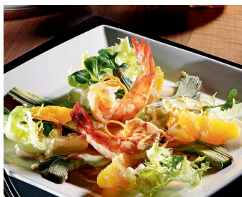
Garnelen auf Artischocken- Orangen-Salat