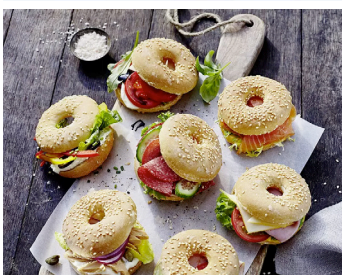
Bagels 7-fach gefüllt