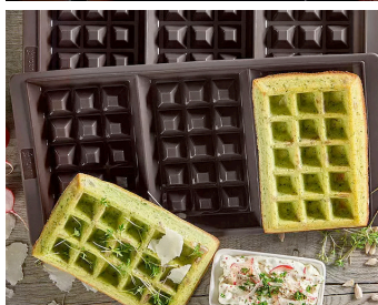
Herzhafte Kräuterwaffeln mit Parmesan und Sonnenblumenkernen