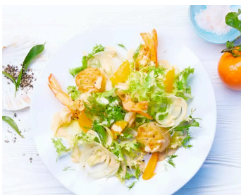
Meeresfrüchte auf Mandarinen-Mayonnaisen Salat