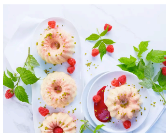
Panna cotta mit Himbeer-Coulis