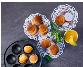
Italienische Tiramisu Bällchen

Noch mehr Rezeptideen finden Sie auf hagengrote.at