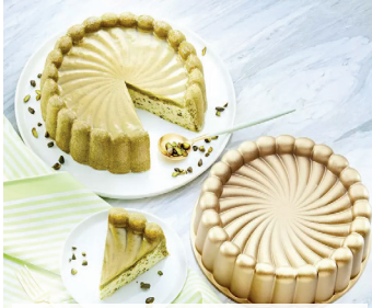
Matcha-Pistazien-Kuchen mit weisser Schokolade und Sake-Gelee >