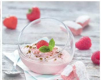
Bavaoise Creme mit Biskuits Roses de Reims >

Noch mehr Rezeptideen finden Sie auf hagengrote.ch