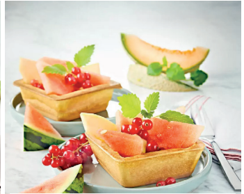
Klassischer Waffelteig für Waffelbecher >