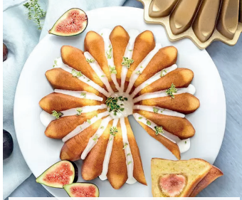
Limonen-Thymian-Gugelhupf mit Feigen und Mandelmilch-Glasur >