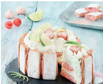
Charlotte mit Erdbeeren und Biskuits Roses de Reims >