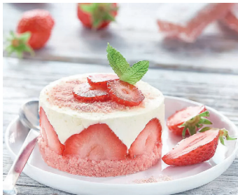
Mini-Cheesecakes mit roten Beeren und Biskuits Roses de Reims >