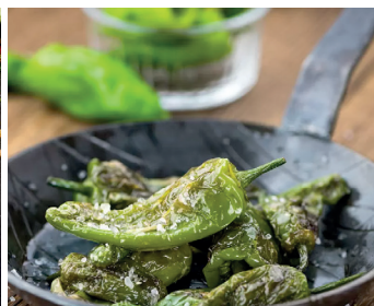
Pimientos de Padron - Mini Paprika aus Padron