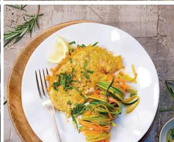
Low Carb Schweineschnitzel in Parmesankruste