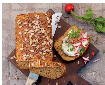
Low Carb Brot