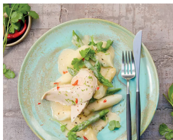
In Kokosmilch pochierte Low Carb Geflügelbrust mit Spargel