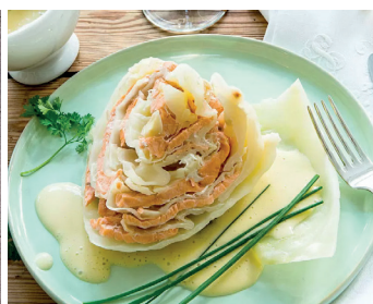
Weißkohl mit Lachsfüllung

Noch mehr Rezeptideen finden Sie auf hagengrote.de