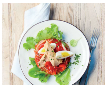
Spanischer Tapas „Zorongollo“ Röstpaprika-Salat