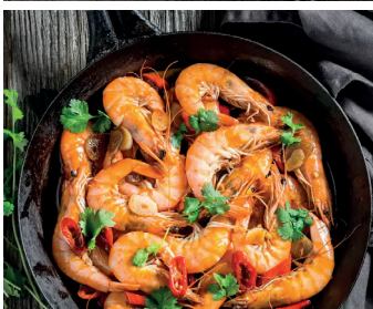
Gambas al ajillo - Garnelen mit Knoblauch