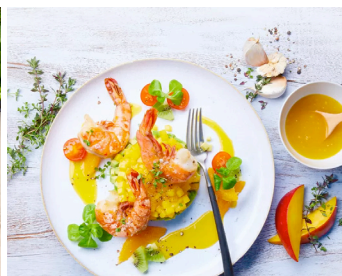
Avocado-Mango-Salat mit Garnelen >