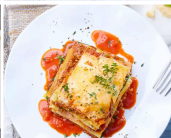
Gemüseblatt-Lasagne mit San Marzano Sauce >