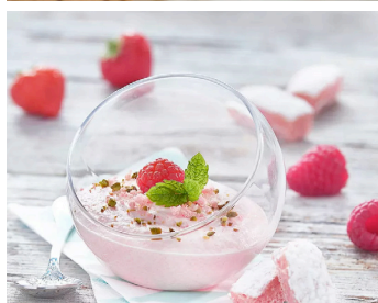
Bavaroise Creme mit Biskuits Roses de Reims >