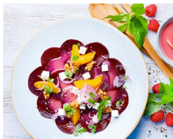
Rote-Bete-Orangensalat mit Himbeer-Fruchtpüree-Vinaigrette >