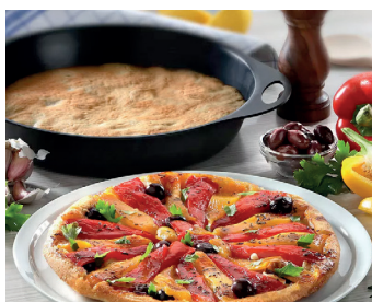
Tarte Tatin Peperonata

Noch mehr Rezeptideen finden Sie auf hagengrote.ch