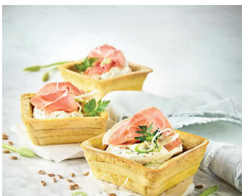
Pikant gefüllte Brot-Waffelkörnchen