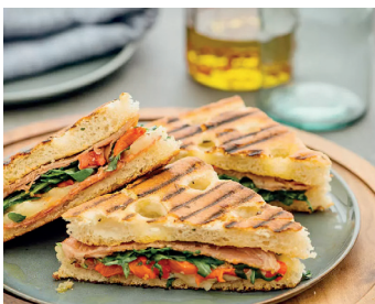
Ligurisches Focaccia Panini