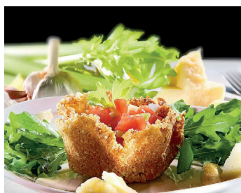
Gefüllte Parmesan-Körnchen auf Rucola