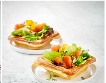
Feine Parmesan-Waffelbecher >