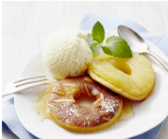
Ananasküchlein mit Eis und Minze >