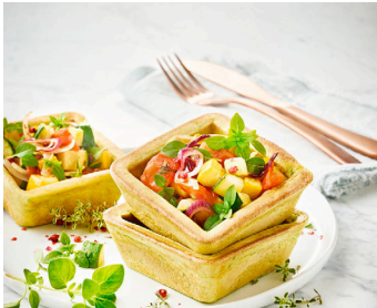
Herzhafte Kräuter-Waffelbecher >