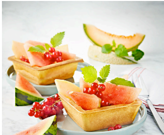
Klassischer Waffelteig für Waffelbecher >