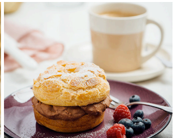
Brandteig-Mandel-Ringe mit Schokoladencreme >

Noch mehr Rezeptideen finden Sie auf hagengrote.at