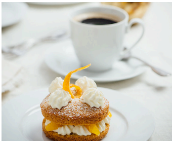
Feine Käse-Sahne-Ringe >