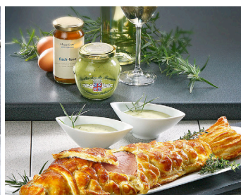
Lachsforelle in Blätterteig mit grüner Estragonsenf-Sauce >

Noch mehr Rezeptideen finden Sie auf hagengrote.ch