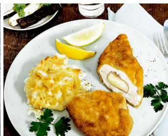
Hähnchenbrust Cordon Bleu mit Schwarzwurzel-Gratin >