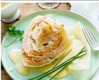
Weisskohl mit Lachsfüllung >