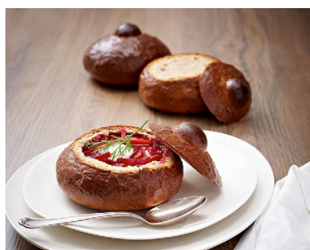
Borschtsch in Brotschalen >