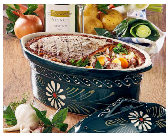
Elsässer Baeckeoffe in Brotkruste >