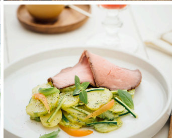
Basilikum-Kartoffelsalat mit Roastbeef >