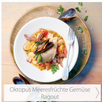
Oktopus Meeresfrüchte Gemüse Ragout