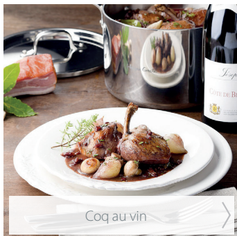
Coq au vin