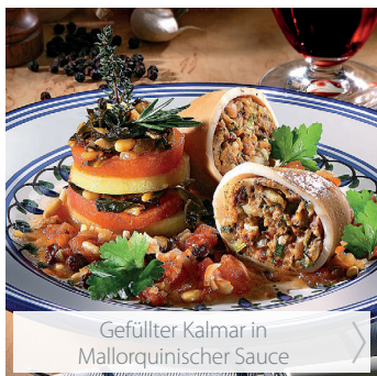
Gefüllter Kalmar in Mallorquinischer Sauce

Noch mehr Rezeptideen finden Sie auf hagengrote.at