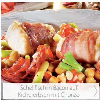
Schellfisch in Bacon auf Kichererbsen mit Chorizo