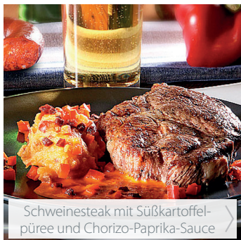
Schweinesteak mit Süßkartoffel- püree und Chorizo-Paprika-Sauce