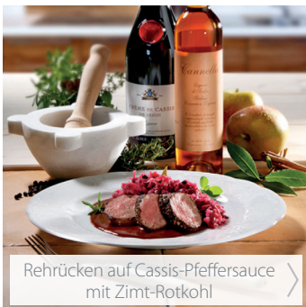
Rehrücken auf Cassis-Pfeffersauce mit Zimt-Rotkohl