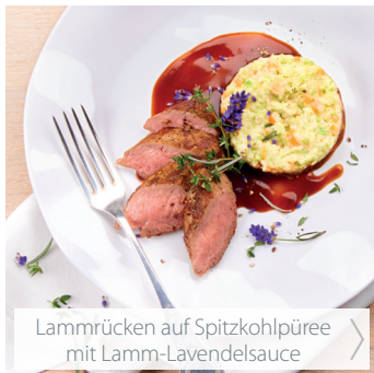
Lammrücken auf Spitzkohlpüree mit Lamm-Lavendelsauce