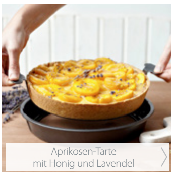
Aprikosen-Tarte mit Honig und Lavendel