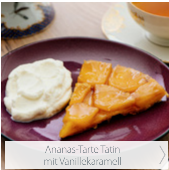
Ananas-Tarte Tatin mit Vanillekaramell