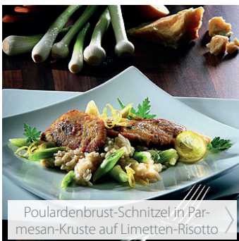
Poulardenbrust-Schnitzel in Parmesan-Kruste auf Limetten-Risotto >