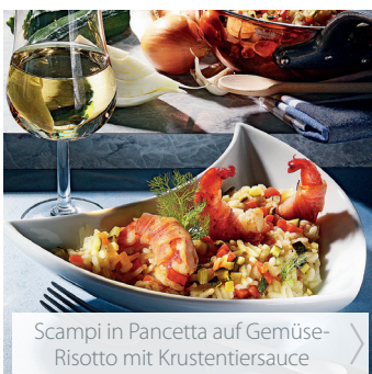
Scampi in Pancetta auf Gemüse-Risotto mit Krustentiersauce >