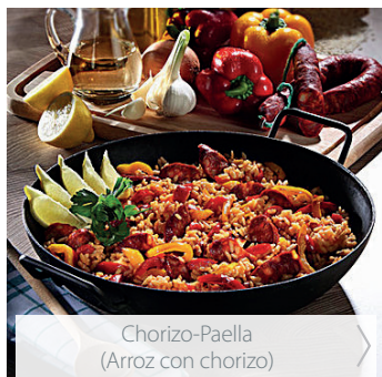
Chorizo-Paella (Arroz con chorizo) >