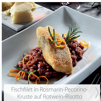
Fischfilet in Rosmarin-Pecorino-Kruste auf Rotwein-Risotto >