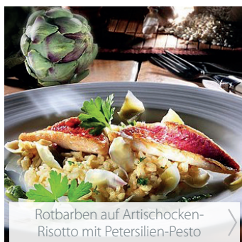
Rotbarben auf Artischocken-Risotto mit Petersilien-Pesto >

Noch mehr Rezeptideen finden Sie auf hagengrote.de >