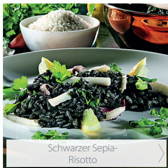
Schwarzer Sepia-Risotto >