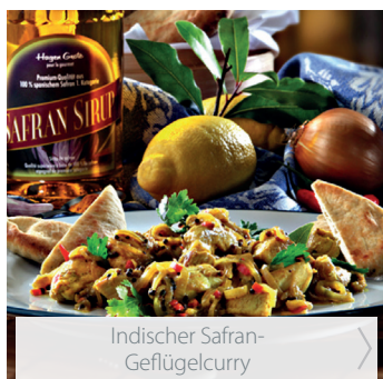
Indischer Safran-Geflügelcurry >