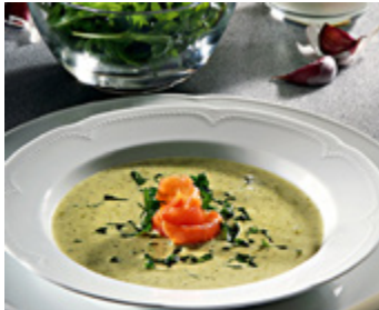
Rucola-Cremesuppe mit Räucherlachs-Rosette