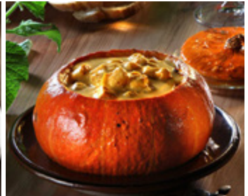
Kürbissuppe nach Paul Bocuse