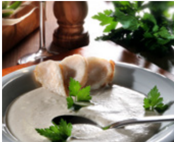
Teltower Rübchen-Rahmsuppe mit Lachs-Rübchen-Beignets