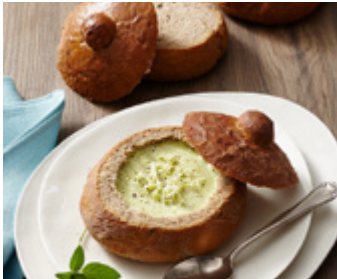
Grüne Salat-Erbсенcremesuppe in Brotschalen