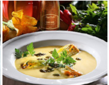
Pikante Kürbисcremesuppe mit gefüllten Zucchini Blüten