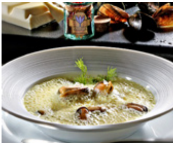
Muschelsuppe mit weisser Schokolade