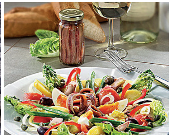
La Salade niçoise

Noch mehr Rezeptideen finden Sie auf hagengrote.at