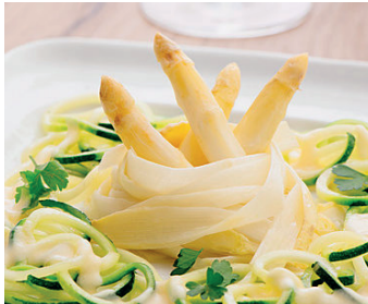
Warmer Zucchini-Mozzarella-Terrine mit Zitronenbutter