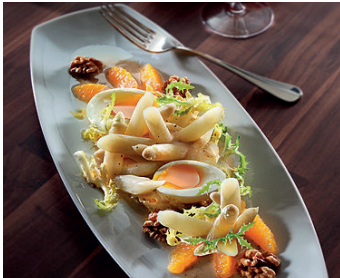
Spargelsalat mit Orangensauce