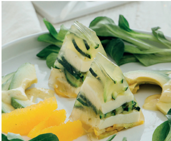
Zucchini-Mozzarella-Terrine auf Avocado-Orangen-Salat