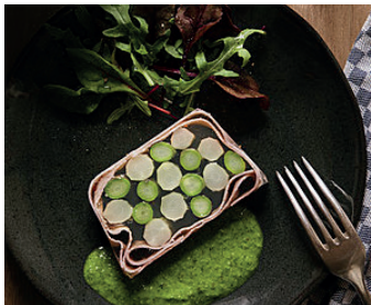
Spargel-Terrine mit Petersiliensauce Deluxe