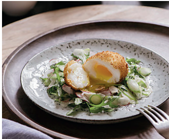
Rohes Spargelsalat mit Agrimetto und frittiertem Ei