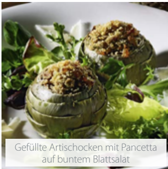
Gefüllte Artischocken mit Pancetta auf buntem Blattsalat