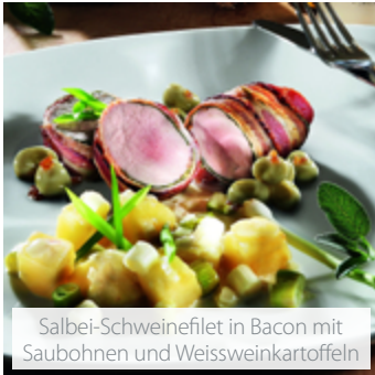
Salbei-Schweinefilet in Bacon mit Saubohnen und Weissweinkartoffeln