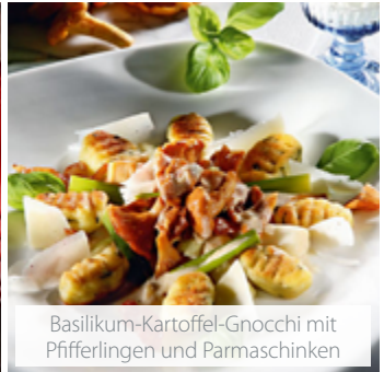
Basilikum-Kartoffel-Gnocchi mit Pfifferlingen und Parmaschinken