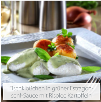
Fischklößchen in grüner Estragon-senf-Sauce mit Risolee Kartoffeln