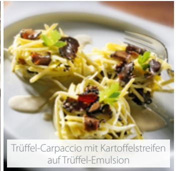
Trüffel-Carpaccio mit Kartoffelstreifen auf Trüffel-Emulsion