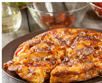
Tortilla de patatas con chorizo - Tortilla de pommes de terre avec chorizo