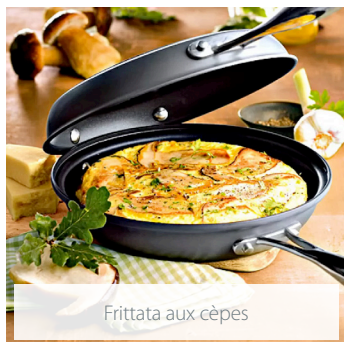
Frittata aux cèpes