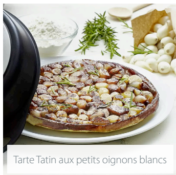
Tarte Tatin aux petits oignons blancs