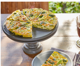
Tortilla de calabacines - Tortilla de courgettes