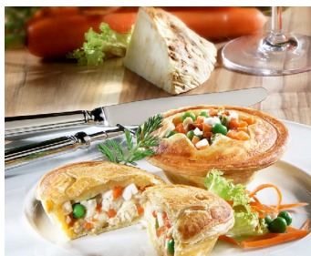
Pâtés de volaille