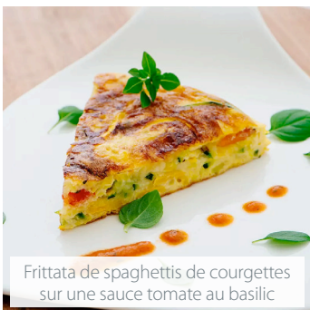
Frittata de spaghetti de courgettes sur une sauce tomate au basilic